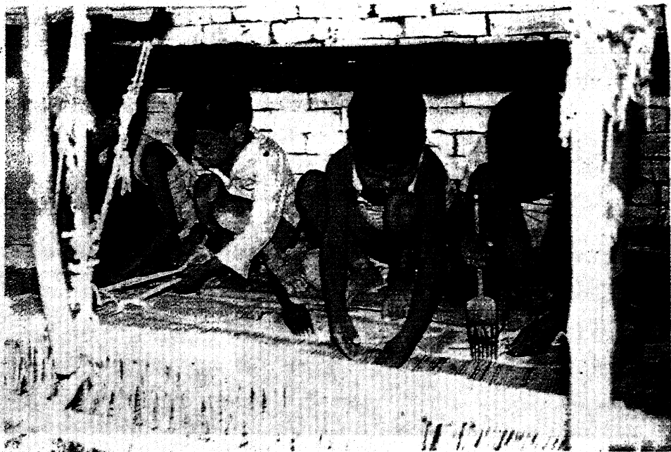
2. कालीन काले पर काम करते बच्चे